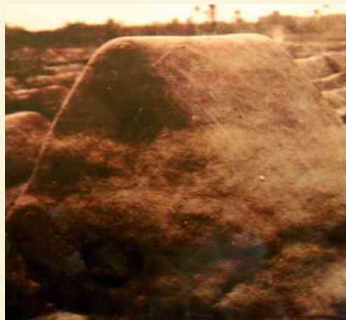
מצבת קבורתו של הבא"ח בבגדד